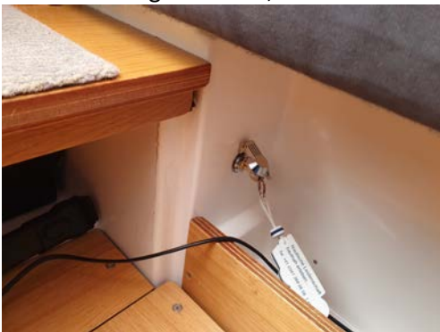
Motorenschlüssel Kajüte backboard