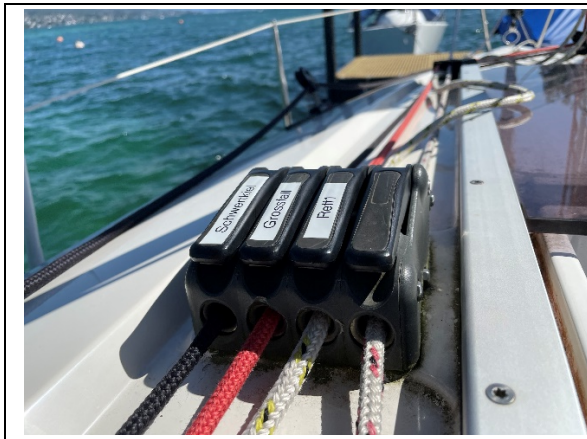
Gelbe Leine (Backbord) 1. Reff