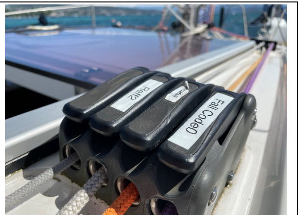
Weiss Leine (Steuerbord) 2. Reff