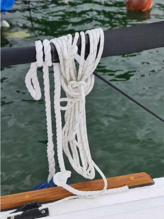
Rollleine Fockroller (weiss)