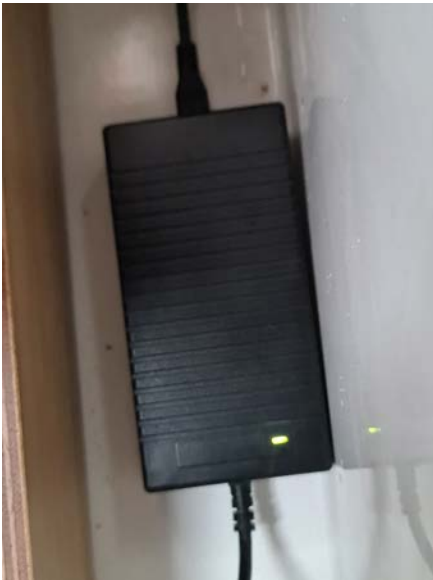
Ladegerät Batterie mit Kontrolllampe (grün Batterie voll, rot Batterie lädt)